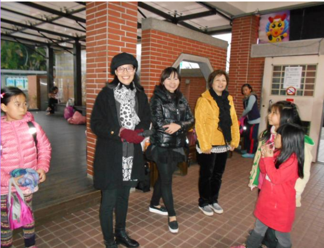
課照班老師於下午 5:30 後協助放學