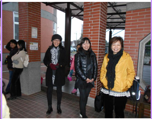
課照班老師於下午 5:30 後協助放學