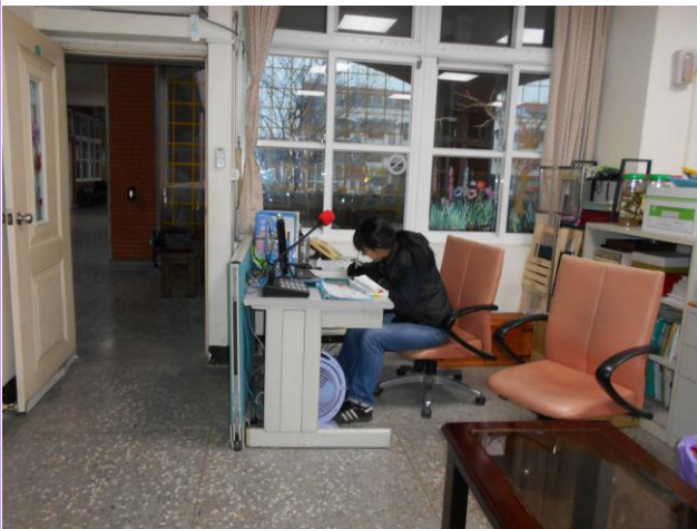
學校外聘安全人員於放學後管制進出校門