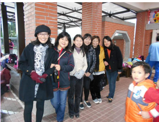
全體課照班老師於校門口合影